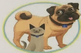
ฉีดวัคซีนให้พวกหนูด้วยนะ

ตามโครงการสัตว์ปลอดโรค คนปลอดภัย จากโรคพิษสุนัขบ้า ประจำปี ๒๕๖๓ เพื่อป้องกันการเกิดและควบคุมการแพร่ระบาดของโรคพิษสุนัขบ้า จึงขอประชาสัมพันธ์ให้ประชาชนที่อยู่ในเขตพื้นที่ อบต.ลาดหญ้า ที่ขึ้นทะเบียนสุนัขและแมวแล้ว สามารถนำกระติกใส่น้ำแข็งมารับวัคซีนได้ที่ กองสวัสดิการสังคม ชั้น ๒ องค์การบริหารส่วนตำบลลาดหญ้า โดยไม่เสียค่าใช้จ่ายแต่อย่างใดให้นำบัตรประจำตัวประชาชนมาด้วย ท่านสามารถมารับได้ตั้งแต่บัดนี้เป็นต้นไป ตั้งแต่เวลา ๐๙.๐๐ - ๑๖.๐๐น.