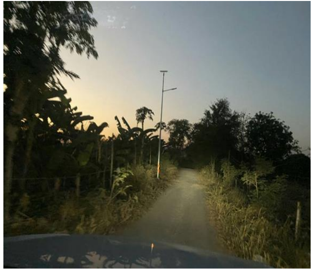
๓๗.โครงการก่อสร้างถนนคอนกรีตเสริมเหล็ก บริเวณซอยเคียงตะวันออก หมู่ที่ ๔