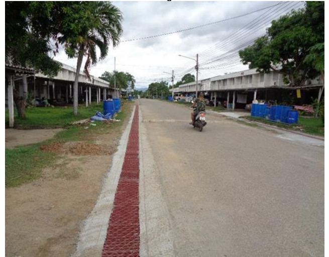
๕๘.โครงการติดตั้งไฟฟ้าแสงสว่างถนน (LED) แบบโซล่าเซลล์ จำนวน ๙ ต้น บริเวณบ้านพักใหม่ หมู่ที่ ๑