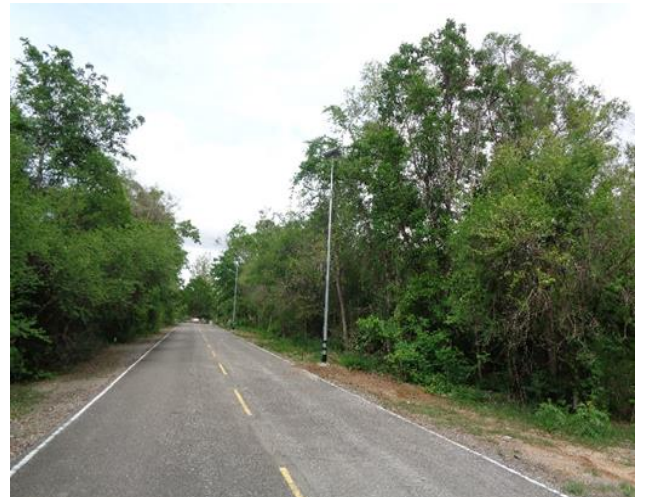
๕๙.โครงการติดตั้งไฟฟ้าแสงสว่างถนน LED บริเวณบ้านพักเก่า หมู่ที่ ๑