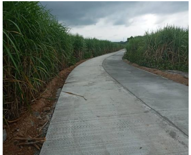
๔๐.โครงการก่อสร้างถนนคอนกรีตเสริมเหล็ก สายทางลงทำนน้ำบ้านโปงกระต่าย หมู่ที่ ๖