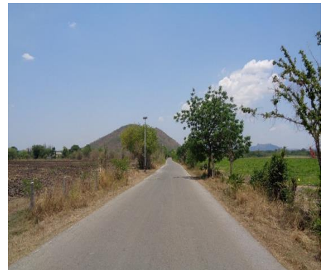
๖๘.โครงการติดตั้งคอมพิวเตอร์ไฟฟ้าถนนสาธารณะ บริเวณสายวัดพุใหญ่ หมู่ที่ ๗