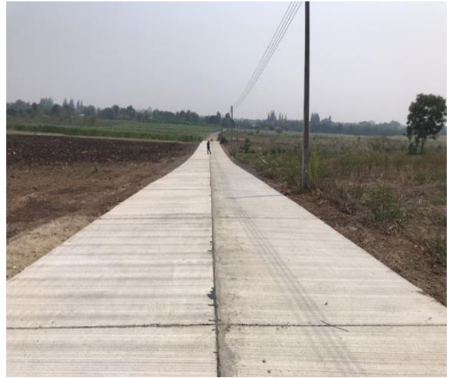
๖๔.โครงการติดตั้งโคมไฟฟ้าถนนสาธารณะ บริเวณสายบ้านจันอุยจรตทางหลวงหมายเลข ๓๒๓ หมู่ที่ ๕